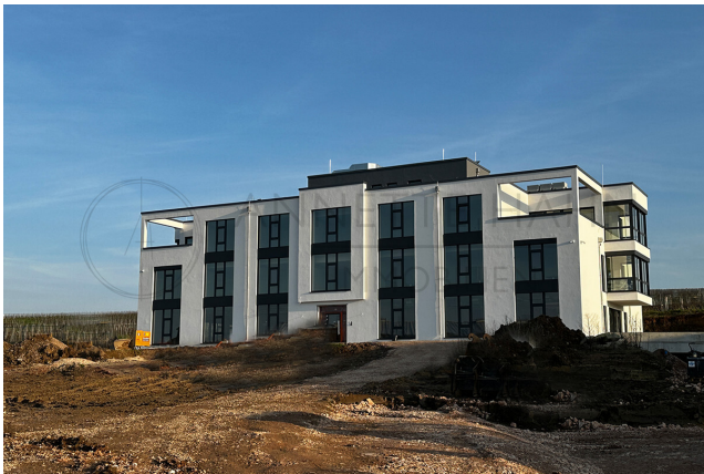
Außen Mrz 24